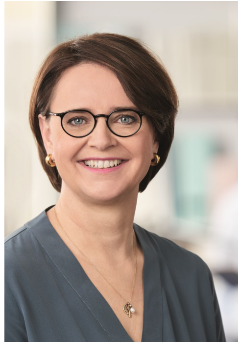
Annette Widmann-Mauz MdB Staatsministerin bei der Bundeskanzlerin Beauftragte der Bundesregierung für Migration, Flüchtlinge und Integration Platz der Republik 1 11011 Berlin ©(030) 227-77217 annette.widmann-mauz@bundestag.de